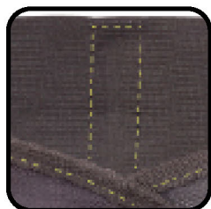
Con 5 varillas plásticas distribuidas en la espalda (cuatro de 6"x½" y una de 6"x1")