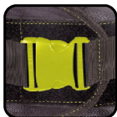
Cinturón para ajuste tipo gancho - felpa y broche de seguridad